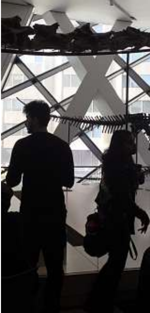
At the ROM in Toronto

A few days walking around Toronto, enjoying the amazing blue skies, the Chinese restaurants and the Royal Ontario Museum, I gathered strength for my journey to the border. The ROM is a huge, eclectic museum where you can see everything, from dinosaurs to mummies and bears that look so real that you think they are still alive. This was the first museum where I tried out my new Press Card, and it gave me such pride to have tickets left for me at the entrance by the PR-girl. Although, I had told a kind woman at the desk already the day before that I was foreign media and she had given me a ticket to everything in the museum, just like that. The English-speaking Canada seems to me a little more open to the world, the light is a little brighter and people are friendly, experiences more diversified, Quebec is not part of each sentence that people speak when you cross over to Ontario.