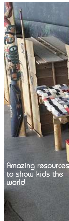
Amazing resources to show kids the world

Another time, I was teaching to really young kids, I think it was first grade, and I mentioned something about human evolution and I referred to Lucy the famous skeleton. One girl raises her hand and I was waiting for her question. She pauses and says, "You know, I have a friend and her cousin's name is Lucy." And she puts a big smile on her face. So she contributed to the discussion in her own way.